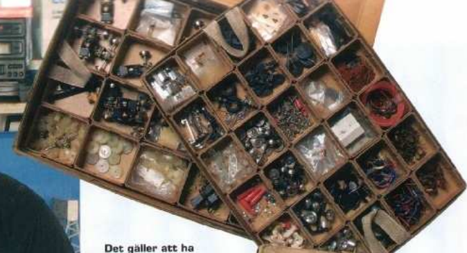
Det gäller att ha reservdelar till hands. Även om Sprint är kända för sin kvalitet så börjar bilarna att få många år på nacken.

MSRC STARTADES 1996 och klubben har idag vuxit till 200 medlemmar. En återkommande aktivitet är swapmeet, när man träffas för att byta bilar och delar. Men minst lika viktigt är att rejsa på enormt stora banor, typ