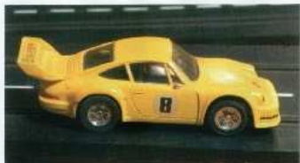
Handknackad, slipad, spacklad och om omlackerad så har 935:an blivit kanonfin igen. När Lasse började meka med den gamla Porschen var den ett vrak.