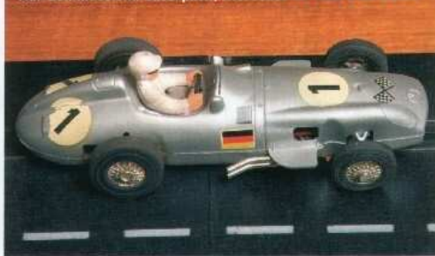
Sprintbilarna går lagom fort och har suverän körkänsla. Här den klassiska Silverpielen, Mercedes W 196 från 1954.

gammal och det är bara att smörja och köra. Men så kostade ju Marklin mer än dubbelt så mycket som Scalextric gjorde.