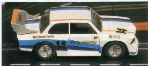
Sista modellen. BMW 320i blev Märklins sista bil och den är kanske den hetaste just nu bland Sprintsamlare. Det ska vara rätt dekaler – som Sachs på sidan.