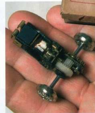
Bra att ha. Börjerna börjar bli gamla och det syns också på kartongen.