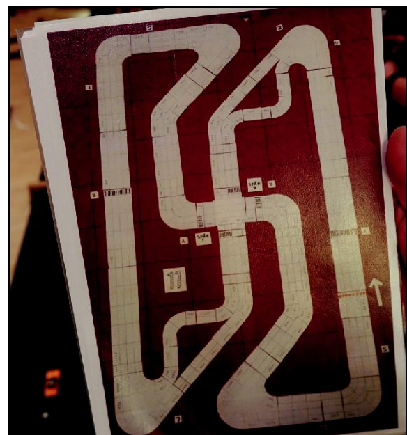
Den banritning som ligger till grund för allt arbete med att montera bandelarna under fredagen.