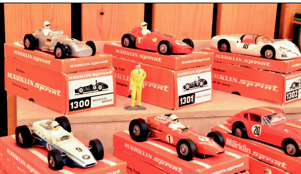
Artikelnummer 1300 var den första bilmodell som levererades av Märklin Sprint. Med åren skulle man utveckla totalt 16 olika biltyper i modell. Variationen i färg och dekor var stor.