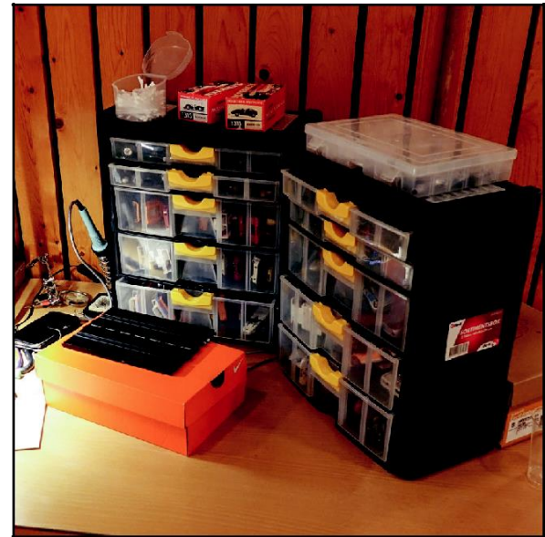
Ingenting är så bra att det inte kan bli bättre. En bärbar verkstad är ovärderlig under helgen.