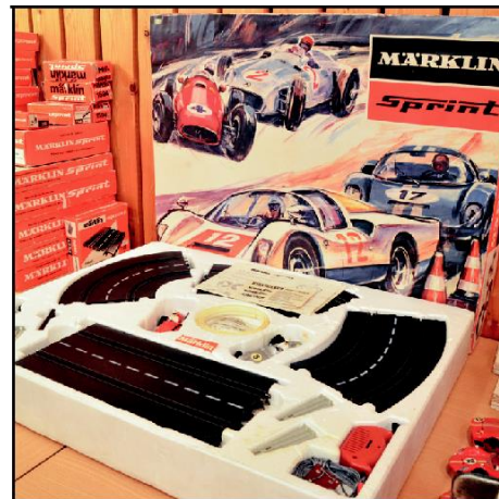
Riktigt trevliga "boxarts" på bilbanornas kartonger väckte nog många's intresse.