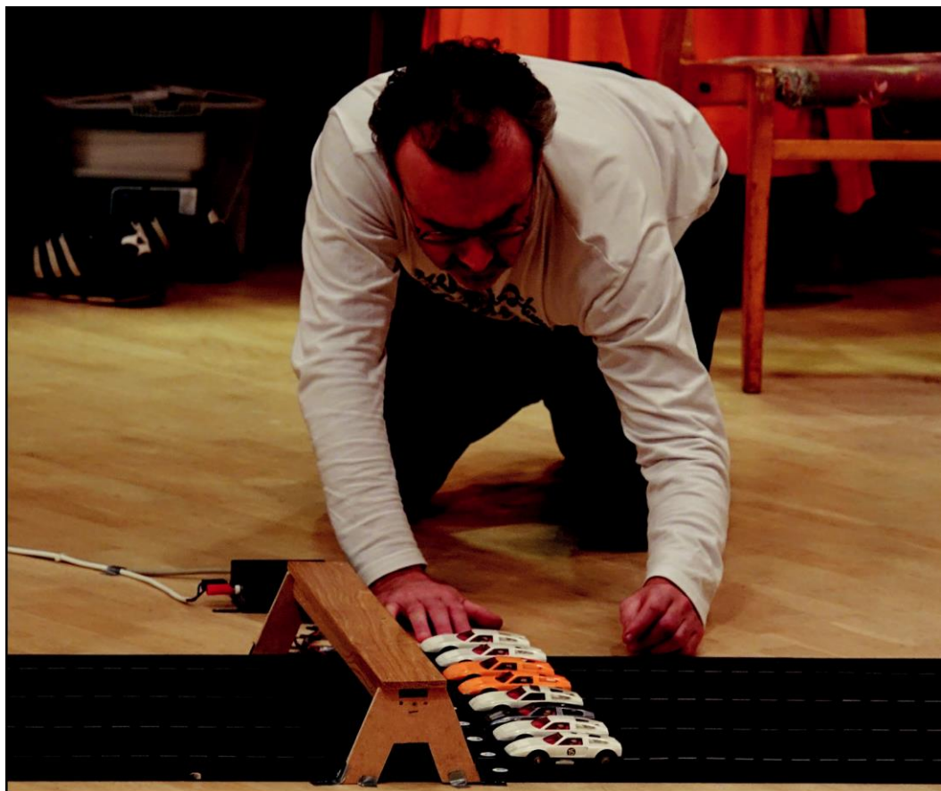
Arbete på golvnivå när bilarna förbereds inför nästa heat. Rampen över banan håller koll på både tjuvstarter och varvtider när medlemmarna i klubben tävlar med varandra.