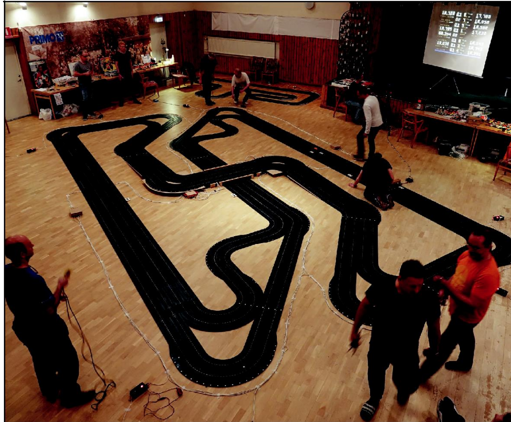
Banan fyller en större del av den stora samlingsalen i Limmareds Folkets Hus. Runt banan kan man se de svarta anslutningsboxar där varje förare kopplar in sitt gashantag.