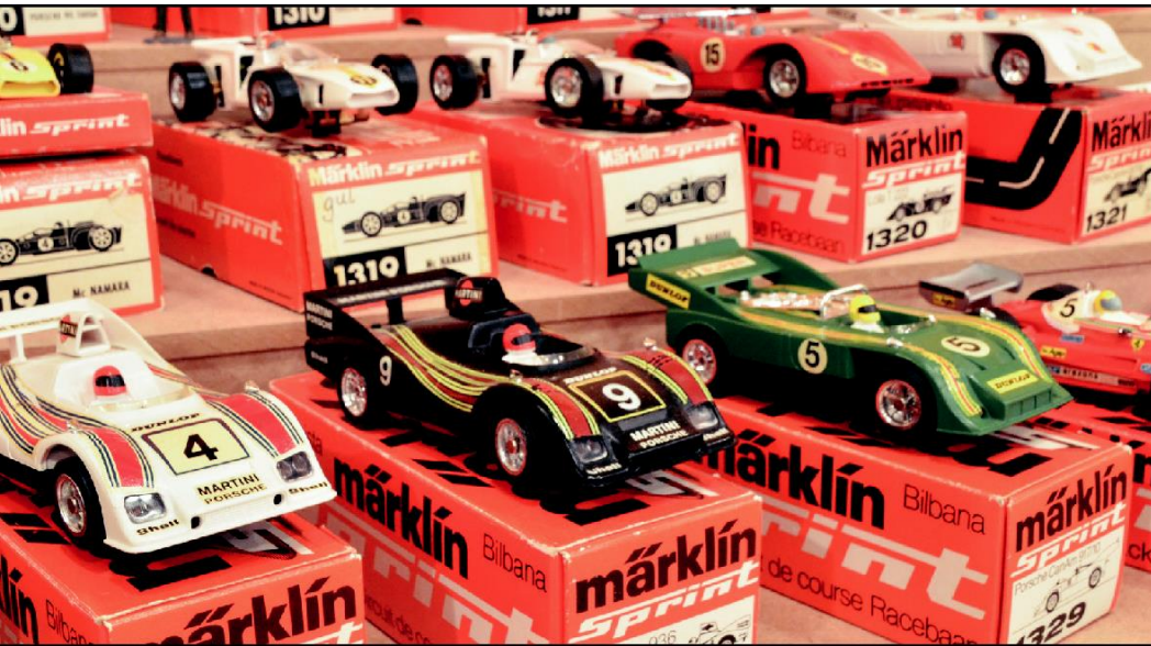
Märklin Sprint har genom året förvandlats från leksak till samlarobjekt. Men i Limmared verkar man rörande överens om att bilarna ska användas till vad de var gjorda för!