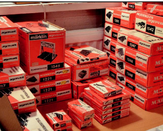
Bilbanesystemet från Märklin Sprint omfattade ett stort antal olika delar och detaljer.