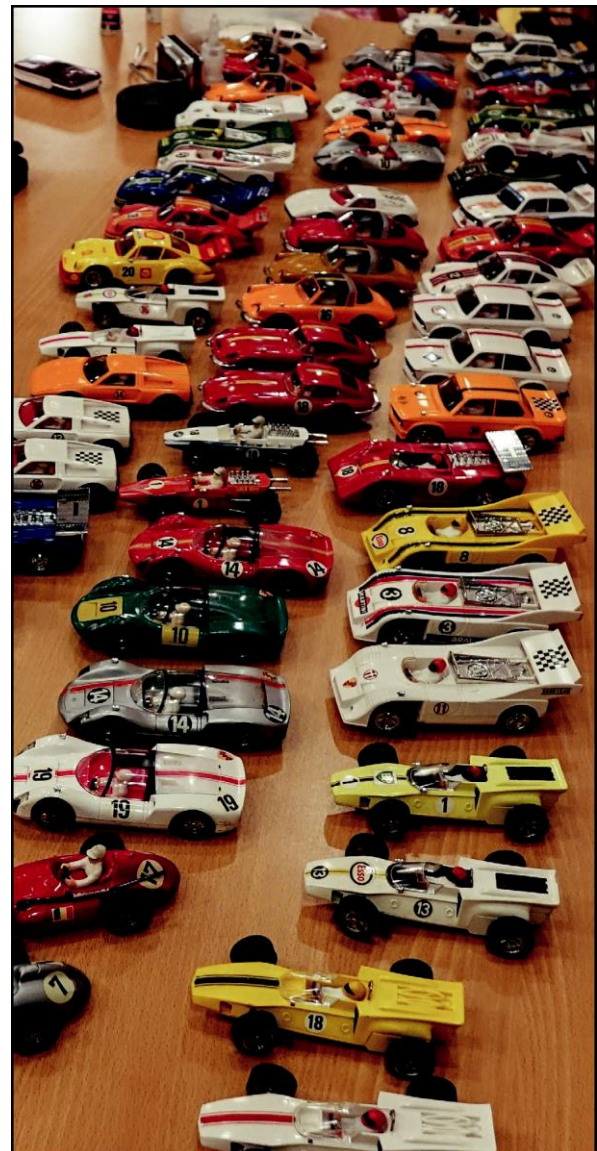
Bilarna har en i grunden bra teknik som fungerar än i dag trots att de är mellan 37 och 52 år.