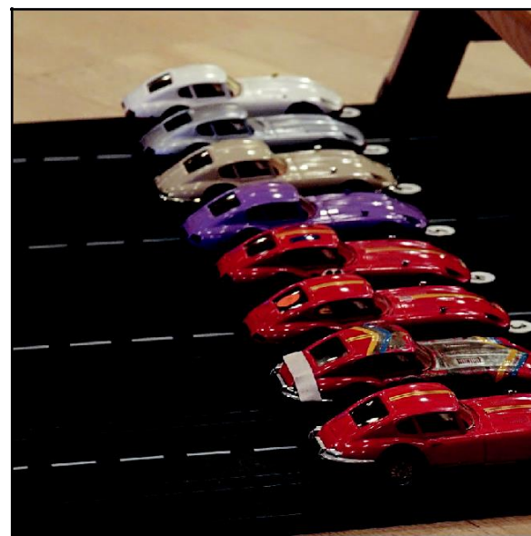
Uppställning inför ett av heaten i klassen med Jaguar E-type, art.nr 1308 hos Märklin Sprint.

På poängtavlan markeras vilka klasser varje tävlande valt att starta i med mässingsfärgade häftstift. Efter de åtta heaten i varje klass fördelas totalt femton poäng till de fem snabbaste förarna. På den analoga poängtavlan markeras poängen med svarta häftstift. Fem poäng till vinnaren, fyra till andraplatsen, tre till trean och så vidare.